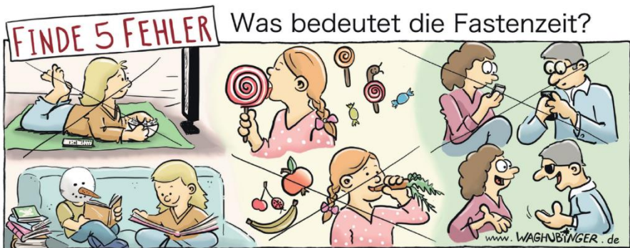
Schneemannkopf, Schnecke, Käfer, falsches Bild durchgestrichen, Augenklappe

auf Süßigkeiten. Aber der Sinn ist nicht, auf etwas zu verzichten, um zum Beispiel schlanker zu werden, sondern um sich auf das Leiden und Sterben Jesu vorzubereiten. Das steht nämlich am Ende der Fastenzeit, am Karfreitag. Deshalb heißt die Fastenzeit auch Passionszeit. Passion ist ein lateinisches Wort und heißt Leiden. Nicht wir selbst sollen leiden, sondern wir bereiten uns vor auf das Leiden Jesu. Indem wir zum Beispiel in der Bibel lesen, anderen Menschen helfen, den Geschwistern und Eltern zum Beispiel. Indem wir nicht so sehr an uns denken, sondern an andere, wie Jesus nicht an sich gedacht hat, sondern an uns.