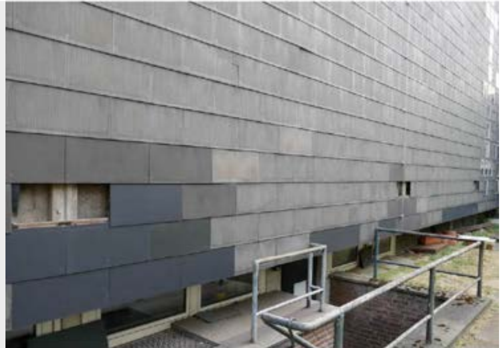
Untersuchungen an der Südwestfassade