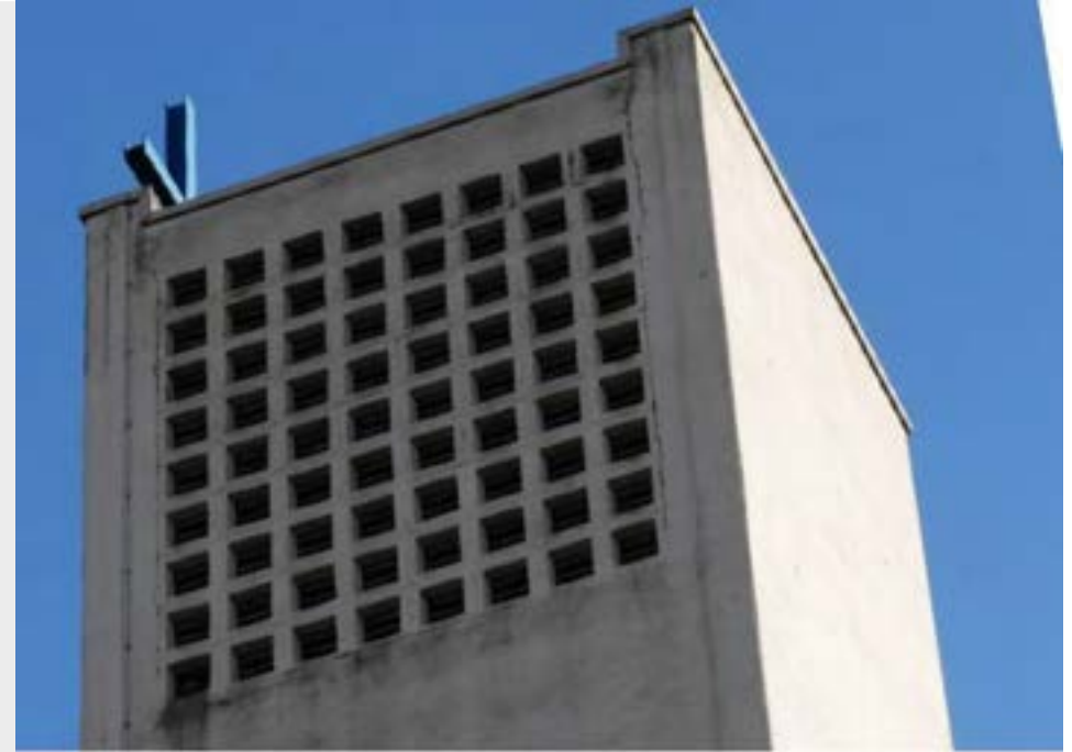
Schadensbild Kirchturm außen