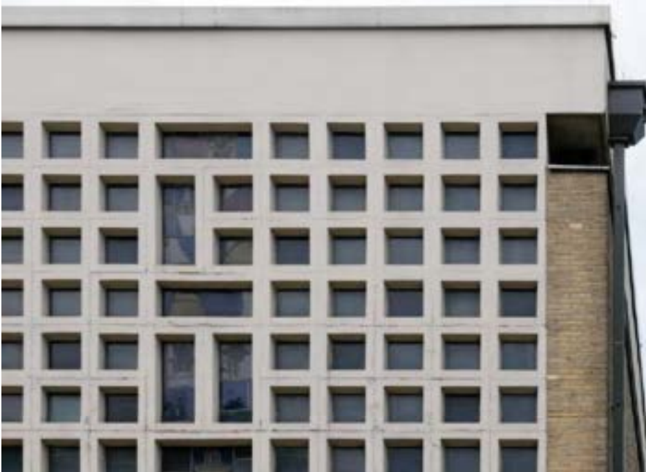
Nordostfasse mit Rissbildungen