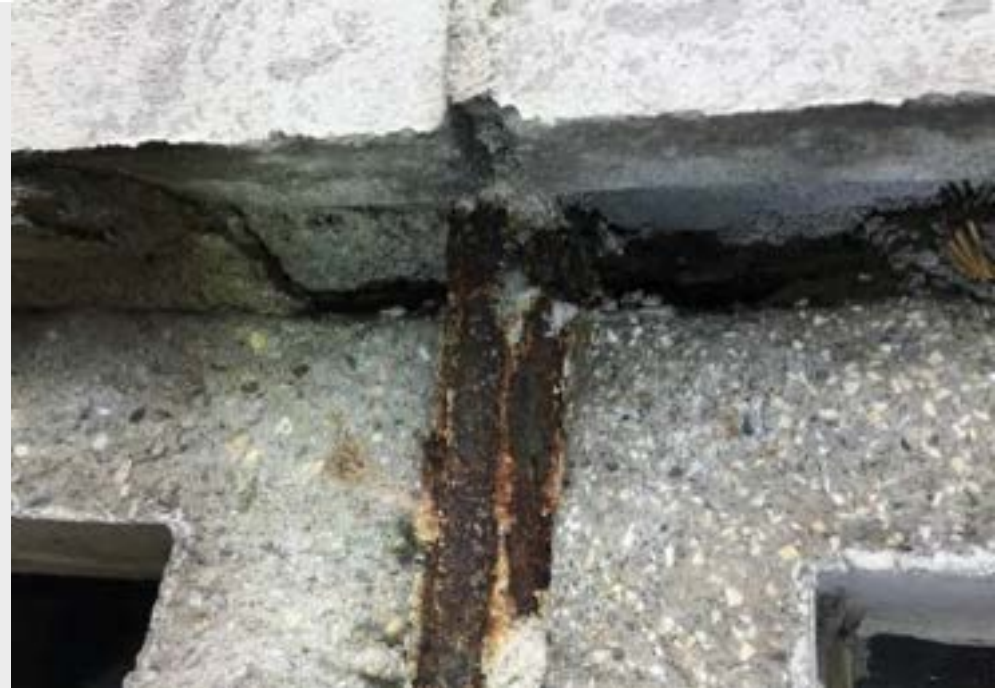
Detail der Bewehrung, als Ursache der diversen Abplatzungen