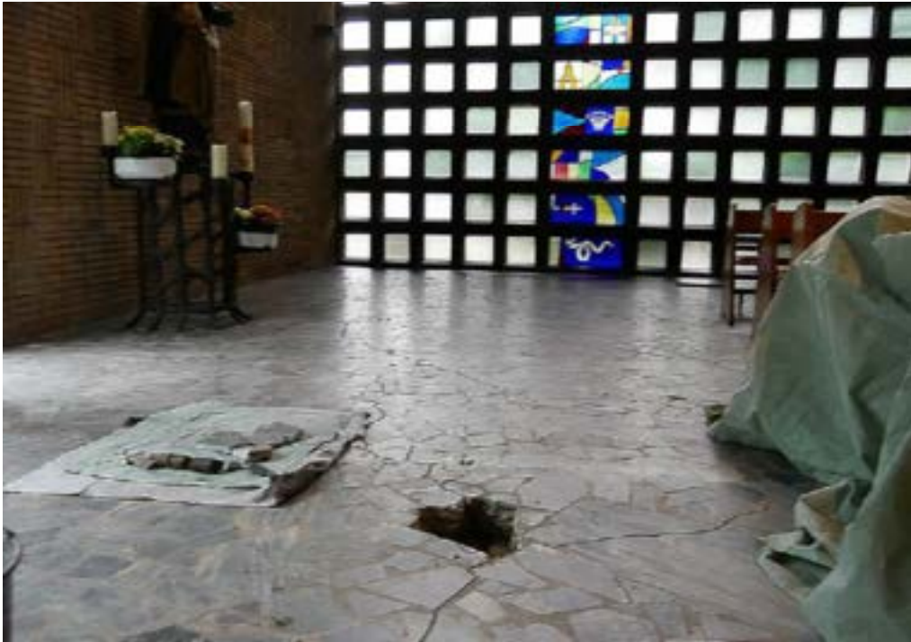
Rissbildung Bodenbereich, Bauuntersuchung