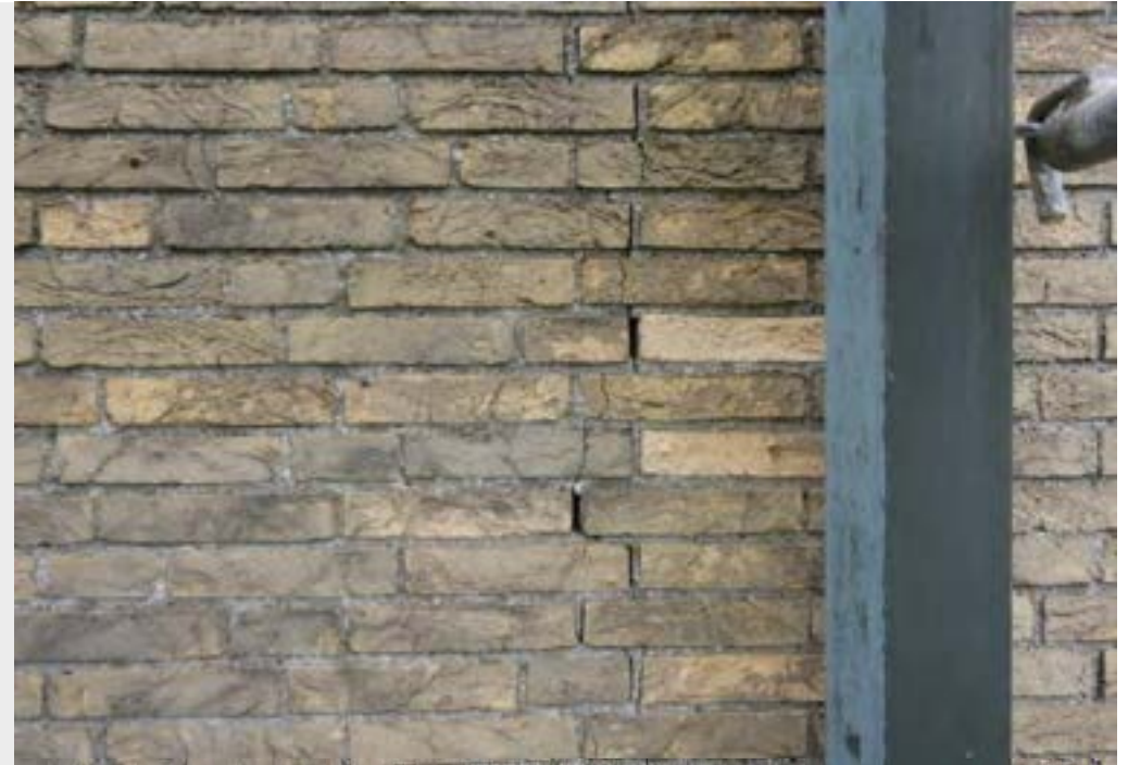
Rissbildung im Mauerwerk