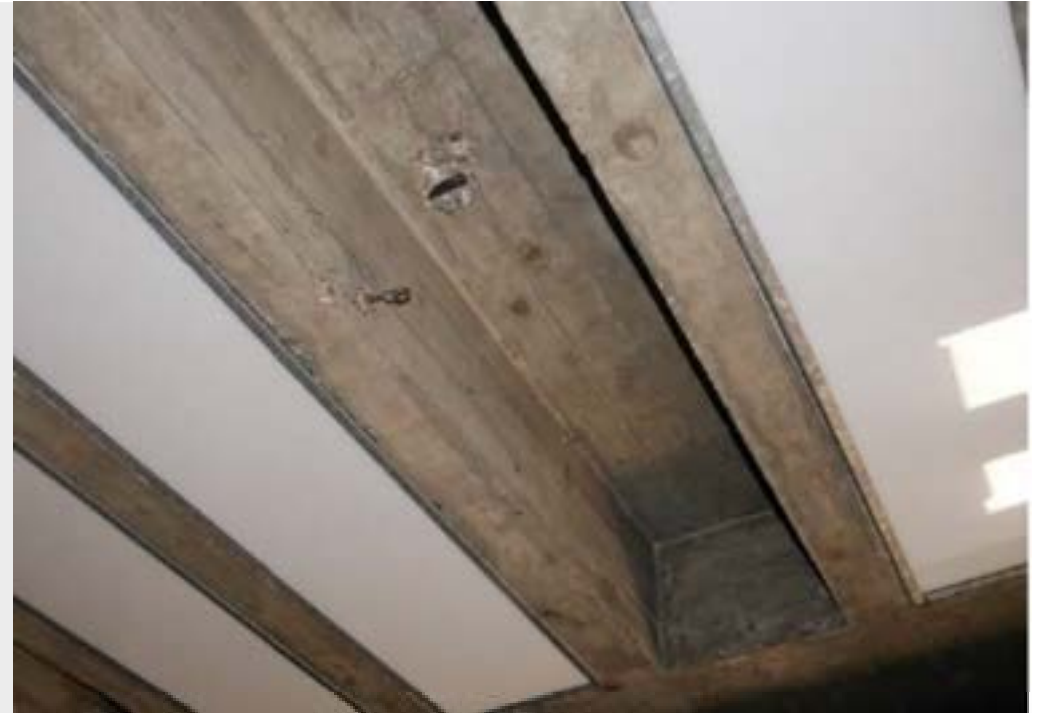
Schäden an Betonkonstruktion unterm Orgelboden