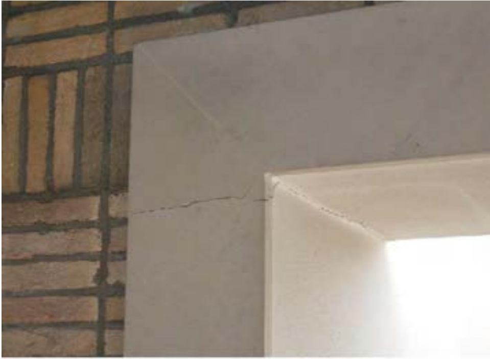
Rissbildung am Fenster